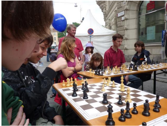
Schach in der Grazer Innenstadt