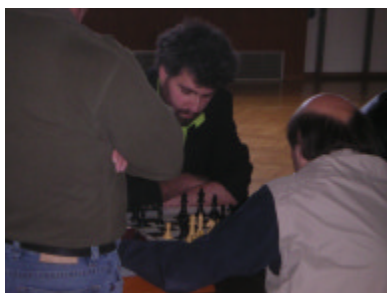
Das Finale: Fahrner-Schein