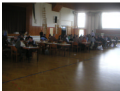
Blick in den Turniersaal