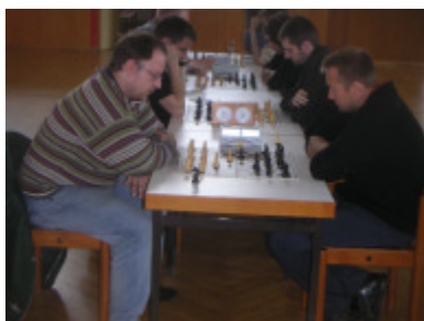
Kleines Finale: Austria II–Styria